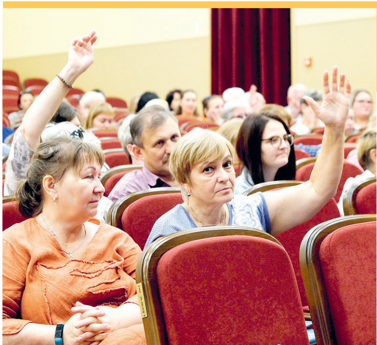
ПРЕСС-СЛУЖБА АДМИНИСТРАЦИИ Г.О. СОЛНЕЧНОГОРСК

Такие семинары проходят в разных городских округах Подмосковья и касаются разных тем, связанных с обеспечением наблюдения на выборах. Опытные эксперты рассказывают будущим наблюдателям, какими правами они обладают, какие ограничения установлены в их работе, а также о ходе самого голосования.